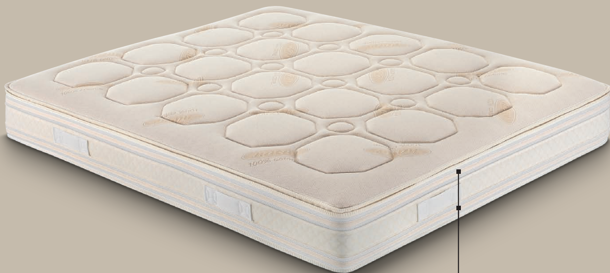
rivestimento BIO COTONE

rivestimento sfoderabile CLASSIC cerniera su tutti i lati e 4 maniglie