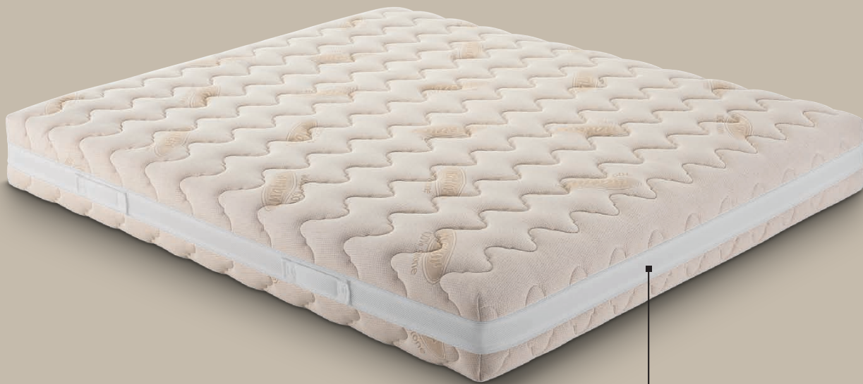
rivestimento BIO COTONE