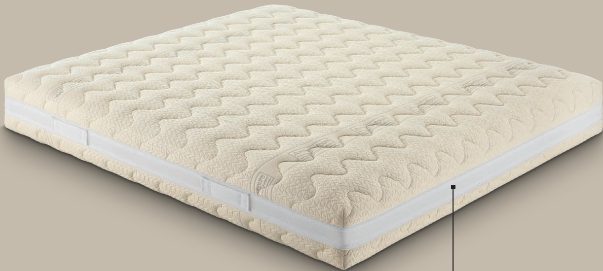
rivestimento AMICOR™ PURE