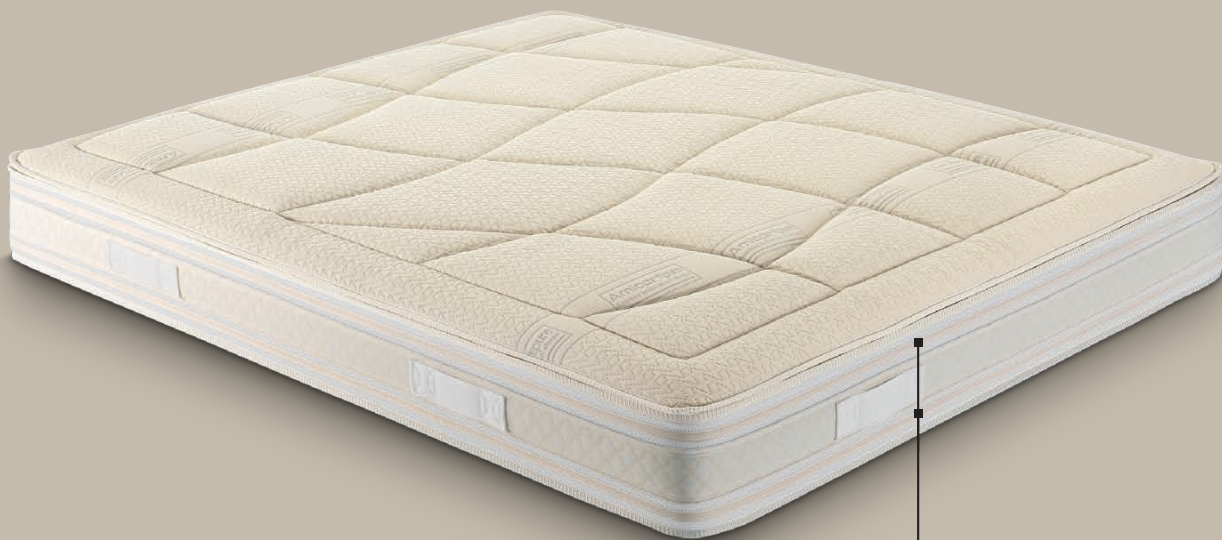
rivestimento AMICOR™ PURE

rivestimento sfoderabile CLASSIC cerniera su tutti i lati e 4 maniglie